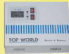
Power Supply & Battery