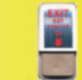
สวิตช์กดออก EG-11