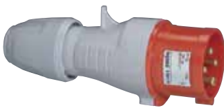
555438 STRAIGHT PLUG