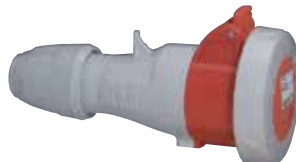
555418 MOBILE SOCKET