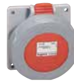
555488 PANEL SOCKET