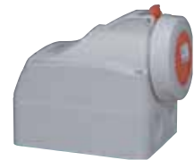
555458 SURFACE MOUNTING SOCKET