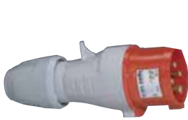
555128 STRAIGHT PLUG