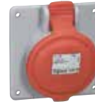
555188 PANEL SOCKET