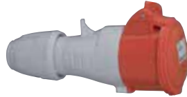
555108 MOBILE SOCKET