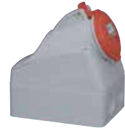
555258 SURFACE MOUNTING SOCKET