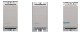
AE2001TEH AE2005EH AE2001TLEH