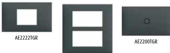
AE2222TGR AE2206TGR AE2200TGR