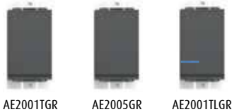
AE2001TGR AE2005GR AE2001TLGR