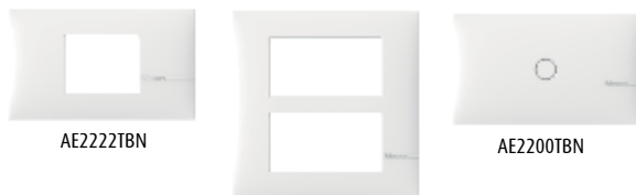
AE2222TBN AE2200TBN AE2206TBN