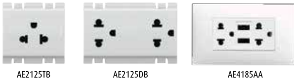
AE2125TB AE2125DB AE4185AA