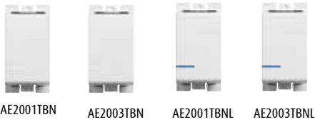
AE2001TBN AE2003TBN AE2001TBNL AE2003TBNL