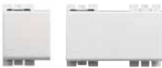
AE2003TB15N AE2003TB3N AE2001TB15N AE2001TB3N