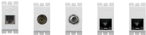
AE2182BN AE2152DB AE2152FB AE2179CSB AE2179C6B