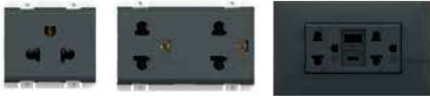
AE2125TGR AE2125DGR AE4185ACGR