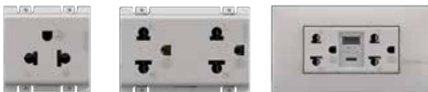
AE2125TEH AE2125DEH AE4185ACEH