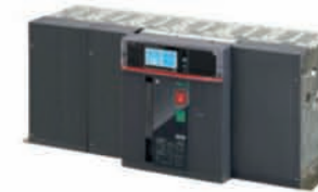
เบรกเกอร์ E6.2 W/D Horizontal