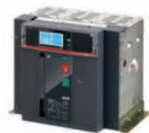
เบรกเกอร์ E4.2 W/D Horizontal