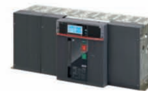
เบรกเกอร์ E6.2 Fixed Horizontal

อุปกรณ์และแบบวงจร ATS แนะนำสำหรับเบรกเกอร์ Emax2 E6.2 :