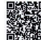
QR Code สำหรับแบบวงจรการต่อระบบ ATS