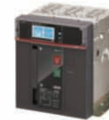
เบรกเกอร์ E2.2 Fixed Horizontal