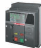
เบรกเกอร์ XT7M