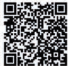
QR Code สำหรับแบบวงจรการต่อระบบ ATS