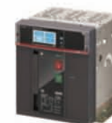
เบรกเกอร์ E2.2 W/D Horizontal