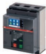
เบรกเกอร์ E1.2 Fixed Horizontal Wall mounted